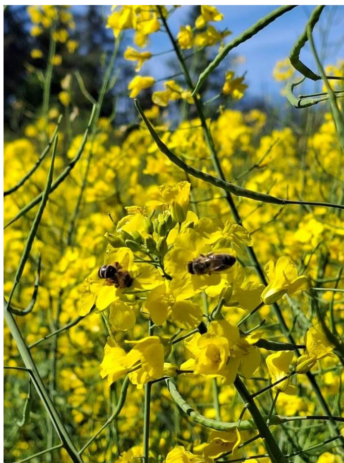
Colza stade G3 (BBCH 712) avec abeilles le 20/04/2026 Janailhac V. LACORRE CDA87