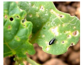
Petite altise sur colza.

Rapprochez-vous de votre conseiller pour en obtenir une.