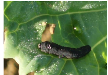
Larve de tenthrède de la rave sur colza.

Seuil indicatif de risque : 25 % de la surface foliaire détruite par les larves de tenthrèdes.