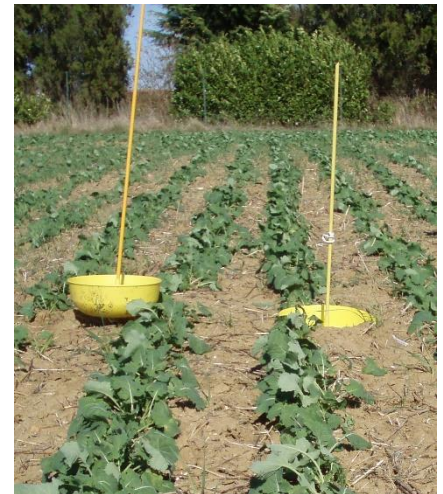
Cuvette jaune en situation.

La majorité des parcelles est toujours en phase sensible et la présence du ravageur est fréquemment observée.