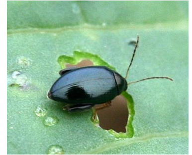
Grosse altise sur colza (photo Terres Inovia).

A ce jour, le risque est nul car l'arrivée de l'insecte sur les parcelles n'est pas effective. Selon la météo de la fin de la semaine, la situation pourrait être amenée à évoluer. La surveillance par le piégeage en cuvette d'une part, et l'observation des morsures d'autre part est à prévoir.