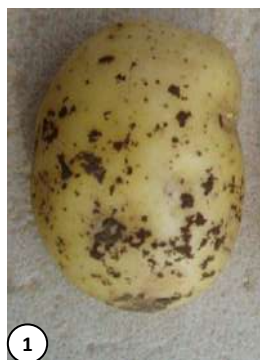
Photo 1 : Sclérotés de rhizoctone brun

Ce champignon altère la présentation des pommes de terre en formant des sclérotés noirs sur l'épiderme. En cas de forte contamination des plants, des problèmes de levée peuvent être observés surtout quand les conditions climatiques sont froides et humides et le plant mal préparé. En attaque plus tardive, un manchon de mycélium blanchâtre peut apparaître à la base des tiges et des tubercules aériens peuvent se développer à l'aisselle des feuilles.