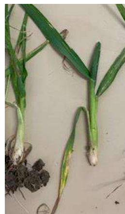
Dégâts de mouche ; pied en poireau et dernière feuille courte

Plante : La dernière feuille reste verte mais est beaucoup plus courte. Elle a du mal à s'extraire de la gaine foliaire. Le symptôme caractéristique est au niveau du pied : le pied est épaissi, en forme de poireaux. Seul le maître brin semble être touché. La larve est visible en découpant la tige. Elle dévore l'épi.