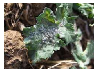
Colonie de pucerons cendrés en manchons

Biologie de l'insecte : les aptères sont de couleur jaunâtre à la mue. Une sécrétion cireuse leur confère leur aspect gris cendré. Les individus sont regroupés en colonies serrées. Ils entraînent une déformation des feuilles, des rougissements et/ou des décolorations de plante.