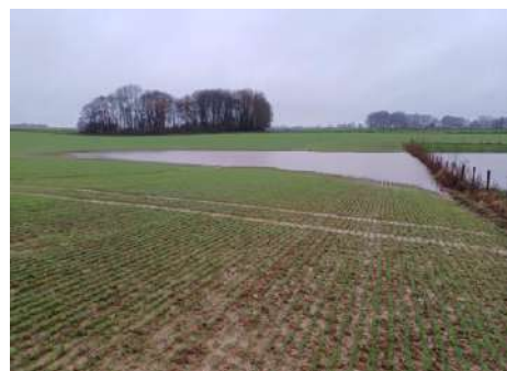
Photo : Parcelle de lin d'hiver à l'eau

Sur le terrain certaines parcelles semées fin septembre sont