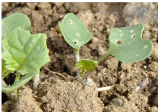
Moins de 25 % de la surface touchée

Seuil indicatif de risque : 8 pieds sur 10 présentant des morsures sans dépasser ¼ de la surface végétative.