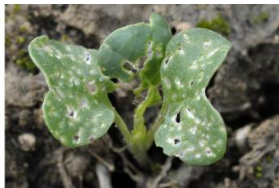
Plus de 25 % de la surface touchée