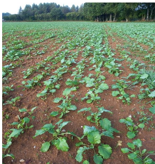
Parcelle de St Amand Jartoudeix Semis le 20/08/2023