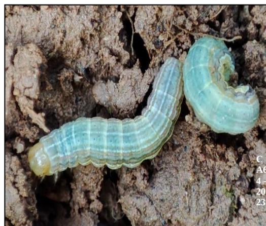
Larves de cirphis (< 10 mm) sur le site de BIDARRAY