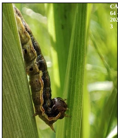
Larve de cirphis (30 mm) sur le sorgho à Hasparren

Des chenilles cirphis sont toujours présentes sur du sorgho (HASPARREN).