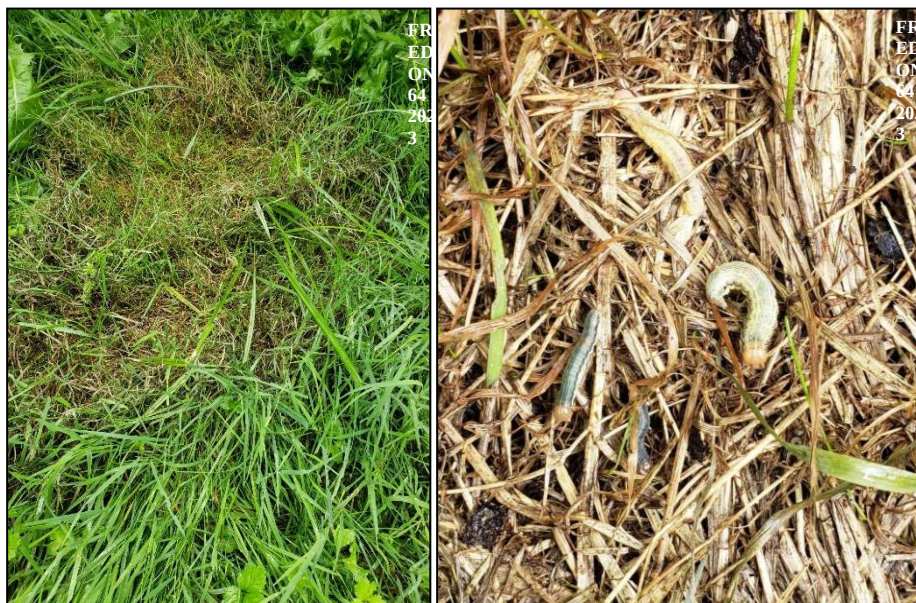
Larves de cirphis (10 à 20 mm) sur un inter-rang de verger de kiwis à Cauneille

Enfin, des papillons cirphis (3) ont été piégés dans des vergers de kiwis et de nombreuses chenilles (10 à 20 mm) sont présentes dans les inter-rangs enherbés sur le secteur de PEYREHORADE (Landes).