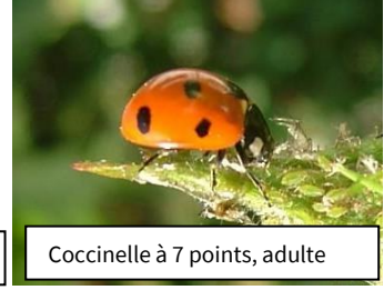
Coccinelle à 7 points, adulte