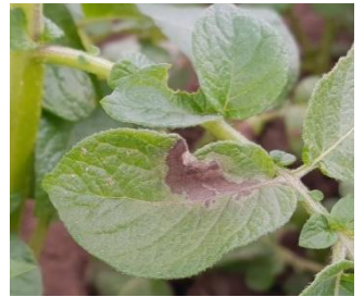
Tache de mildiou

Des symptômes tels que des taches sur feuilles ou des plantes totalement attaquées sont observés sur l'ensemble des secteurs. Il y a un fort développement de mildiou au sein du Calvados et de la Seine-Maritime. Pour ce dernier, le mildiou plutôt sporulant est présent sur l'ensemble d'une parcelle.