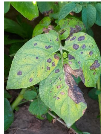
Taches d'alternariose, secteur Calvados

L'Alternariose est une maladie de faiblesse (particulièrement pour A. alternata , qui se développe surtout sur les feuilles déjà atteintes par A. solani , ou sur des feuilles « faibles »), puisqu'elle se développe d'abord sur les feuilles et les plantes les plus faibles : vieilles feuilles (bas de tiges) ou abîmées (vent, grêle), plantes en manque d'eau, de lumière et/ou d'éléments nutritifs, particulièrement l'azote, le manganèse, le magnésium et le soufre.