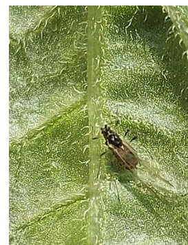
Puceron ailé, Myzus persicae (Chambre d'agriculture de Normandie)