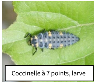
Coccinelle à 7 points, larve