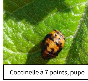
Coccinelle à 7 points, pupe