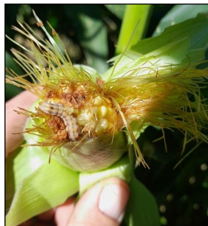
Chenilles à un stade de développement avancé (Abense-de-Haut)

Des chenilles Héliothis, à plusieurs stades de développement, ont été repérées sur des parcelles de maïs à Saint-Pée-sur-Nivelle et Abense-de-Haut. Causant des dommages sur les épis de maïs doux, maïs semences et haricots verts, il faut faire preuve de vigilance sur ces cultures.