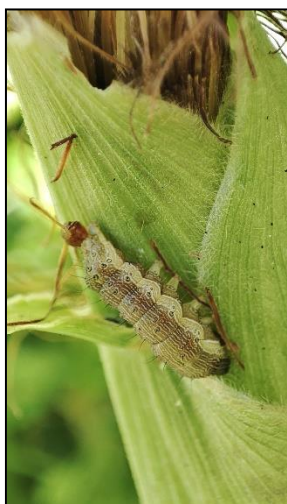
Jeune chenille (Saint-Pée-sur-Nivelle)