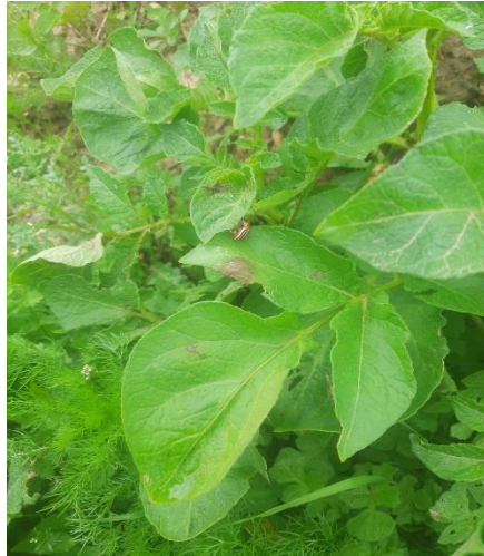
Taches de mildiou sur tas de déchets

Il est très important de gérer les tas de déchets et les repousses pour limiter les risques d'inoculum primaire.