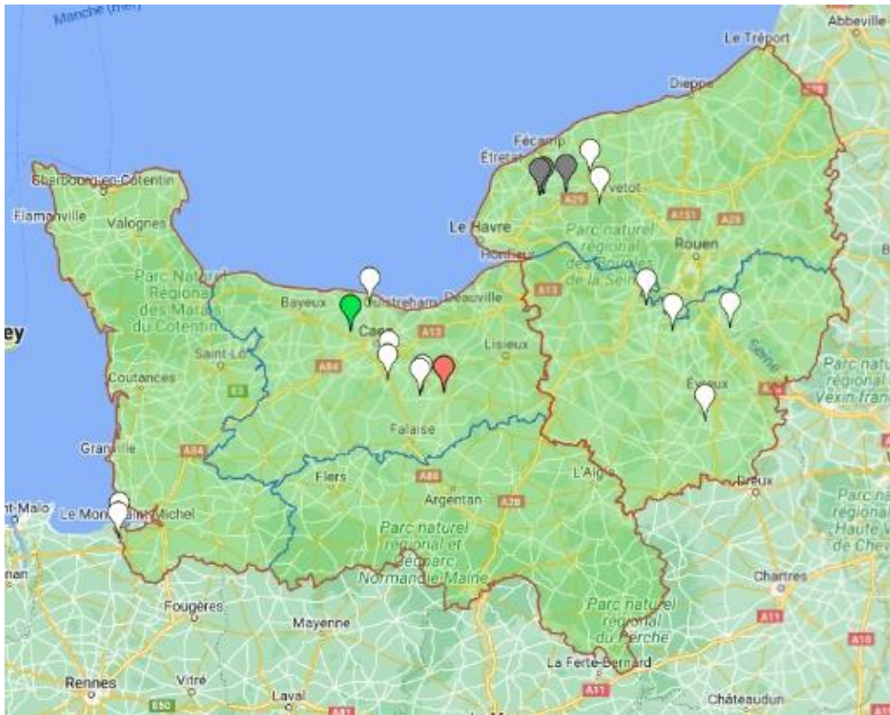
Carte des parcelles du réseau BSV Pomme de terre sur Vigicultures (En noir : parcelles sans informations, en blanc : parcelles allant du stade 00 « non levée » au stade 31 « 10% des plantes adjacentes se touchent », en vert : parcelle au stade 35 « 50% des plantes adjacentes se touchent », en rouge : parcelle au stade 60 « Floraison ».)

Les pommes de terre des parcelles présentes sur le secteur de la Seine-Maritime ne sont pas encore levées. En revanche, sur les secteurs du Calvados, de l'Eure et de la Manche, les parcelles sont toutes levées. Plusieurs d'entre-elles sont au stade 11 « Début du développement des feuilles ». Une parcelle du Calvados est au stade de floraison et une seconde a des rangs qui commencent à se fermer avec au moins 50 % de plantes adjacentes qui se touchent.