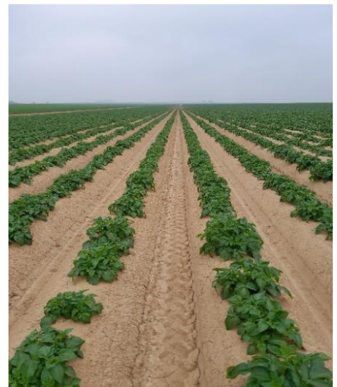
Parcelle au stade « début de développement des feuilles » secteur Calvados

Les conditions météorologiques prévues sont favorables à la levée des dernières parcelles de pommes de terre, malgré des températures matinales fraîches.