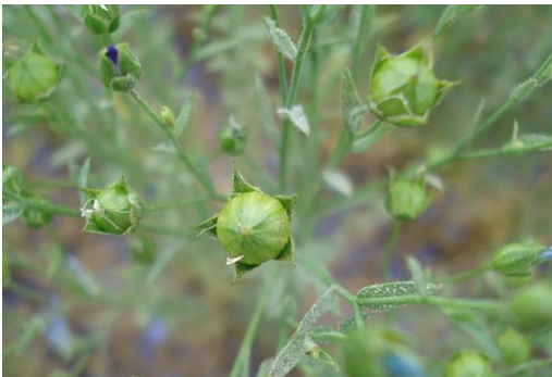
Oïdium généralisé sur lin

Malgré tout, hormis sur ces derniers semis, le stade de sensibilité à l'oïdium est dépassé.