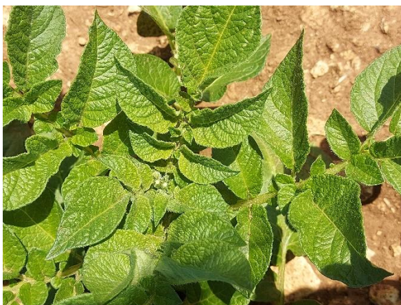
Parcelle au stade « apparition des inflorescences », secteur Calvados (Chambre d'agriculture de Normandie)

Pour rappel, le stade de levée sur une parcelle est atteint lorsque l'on voit les rangs, ce qui équivaut à 30 à 50% de plantes définies comme étant levées.