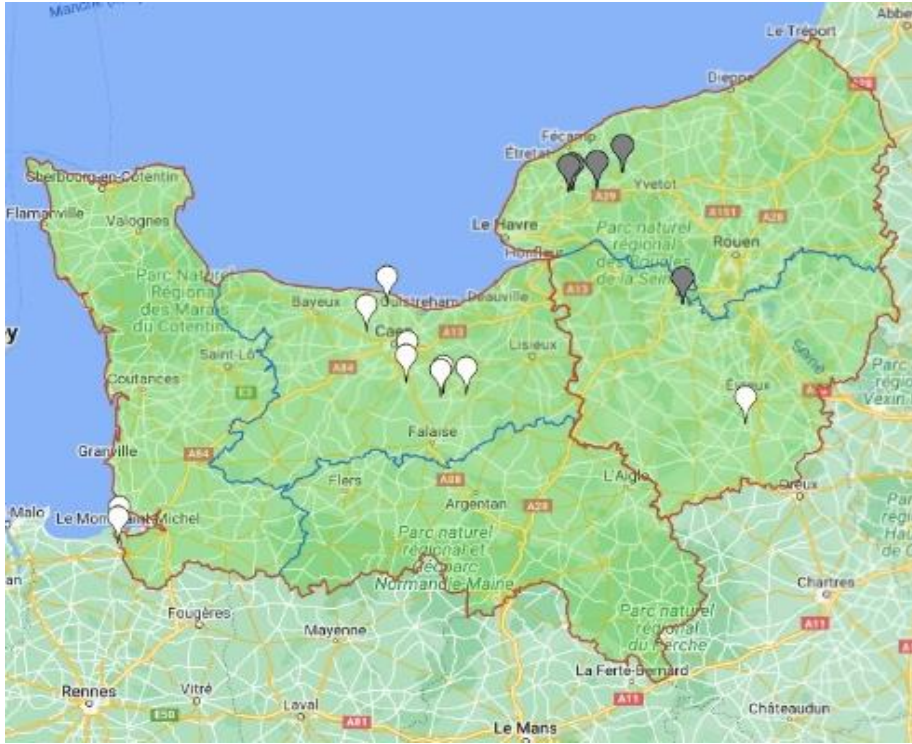
Carte des parcelles du réseau BSV Pomme de terre sur Vigicultures (En blanc : parcelles avec observations, en noir : parcelles sans observations)

Les parcelles lèvent dans le département du Calvados. Dans ce dernier, deux parcelles sont au stade « début du développement des feuilles » et une parcelle est au stade « apparition inflorescence ». Les pommes de terre des parcelles restantes du réseau ne sont pas levées ou sont en cours de levées. La carte ne reflète donc pas encore l'ensemble des parcelles du réseau pomme de terre de Normandie (15 parcelles inscrites dans Vigicultures).