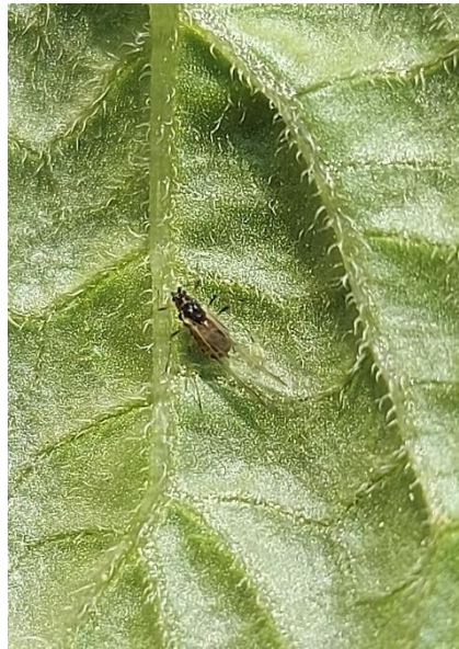
Puceron ailé, Myzus persicae (Chambre d'agriculture de Normandie)