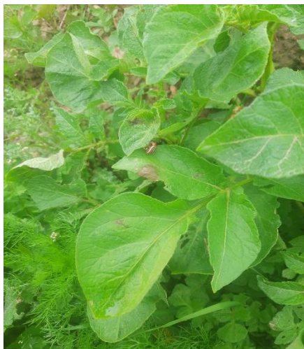
Taches de mildiou sur tas de déchets (COMITE NORD)

Il est important de gérer les tas de déchets et les repousses pour limiter les risques d'inoculum primaire.