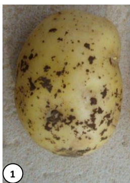
Photo 1 : Sclérotose de rhizoctone brun

Ce champignon altère la présentation des pommes de terre en formant des sclérotose noirs sur l'épiderme. En cas de forte contamination des plants, des problèmes de levée peuvent être observés surtout quand les conditions climatiques sont froides et humides et le plant mal préparé. En attaque plus tardive, un manchon de mycélium blanchâtre peut apparaître à la base des tiges et des tubercules aériens peuvent se développer à l'aisselle des feuilles.