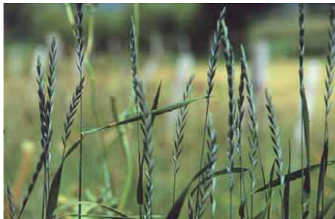
▲ Le chiendent concurrence les cultures en place : en plus de la compétition aérienne directe, ses racines ont un effet allélopathique.

À l'inverse, les outils à disques vont favoriser la dissémination du chiendent en sectionnant les rhizomes 2 . Un fragment de 5 mm de long suffit à donner naissance à une plante autonome.